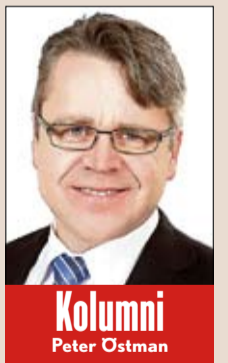
Kolumni Peter Östman